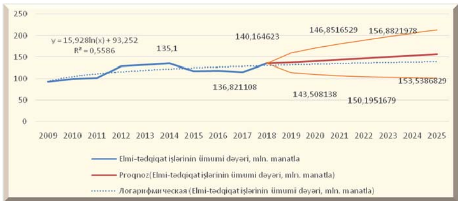
Qrafik 1. Azərbaycanda ETİ-nin ümumi dəyərinin 2025-ci ilədək proqnoz qiymətləri

Qrafik 1-dən istifadə edərək Azərbaycan Respublikasında intellektual kapital üzrə ETİ-nin ümumi dəyərinin proqnoz qiymətlərini də müəyyən etmək olar. MS Excel proqramına əsasən ARDSK-nin məlumatlarından istifadə edərək Azərbaycan Respublikasında intellektual kapital üzrə elmi-tədqiqat işlərinin ümumi dəyərinin gələcək dövr üzrə proqnozlaşdırılması mümkündür bu da bütövlükdə, qrafik 1-də təsvir edilmiş və aşağıdakı nəticəni alırıq.